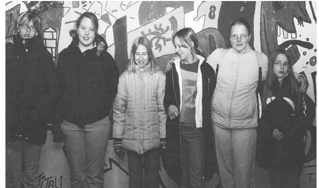
Die Meinerzhagener Kindergruppe der DPF warten auf viele Campteilnehmer