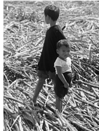
Kinder auf Zuckerrohr-Plantage