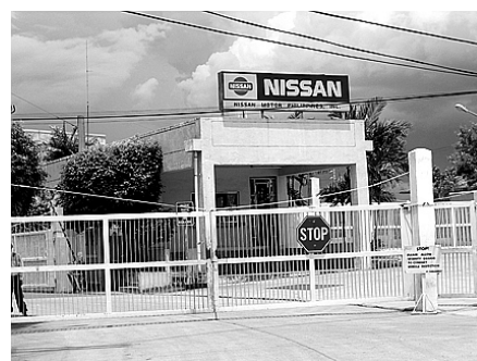
Nissan in der Freihandelszone von Luzon

Immer mehr Produktionsarbeiter in der Industrie werden zu „Dienstleistern“ erklärt, auch Leiharbeitsfirmen und verlieren ihre erkämpften Rechte. Mit dem „Herkunftslandprinzip“ hätten die Unternehmer das Recht, die Beschäftigten nach den jeweils niedrigsten Standards zu entlohnen. Dafür bräuchte das Unternehmen nur einen „Briefkasten“ in einem Land mit niedrigerem Lohnniveau.