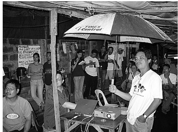
Besuch eines Streikpostens bei Philippinenreise 2004

Um 125 Pesos soll der Mindestlohn landesweit angehoben werden (100 Pesos = 1,80 €). Diese Forderung wird bei Demonstrationen von Arbeitern und Stadt-Armen durch das Tragen von roten Armbinden gekennzeichnet. Der echte Wert der Löhne liegt Anfang 2006 12% unter dem Wert von 1989! In diesem Jahr wurde zuletzt der gesetzliche Mindestlohn erhöht. Die Lebenshaltungskosten sind in den 4 Jahren der Arroyo-Regierung für eine 6-köpfige Familie um 25% gestiegen (durch Ölpreise, Mehrwertsteuererhöhung etc.). Im Großraum Manila liegen die offiziellen Lebenshaltungskosten für eine 4-köpfige Familie bei 690 Pesos/Tag, der Mindestlohn aber nur bei 275 Pesos! (Stand Dez. 05) Auf dem Land sind die Unterschiede noch krasser: Die Landarbeiter, z.B. Zuckerrohrarbeiter, verdienen nur zwischen 40 und 230 Pesos am Tag!