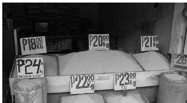
Preise für 1kg Reis 2004 in den Philippinen

Davon abgesehen sind gesundheitliche Risiken für die 2,5 Milliarden Asiaten, für die der Reis Hauptnahrungsmittel ist, nicht ausgeschlossen.