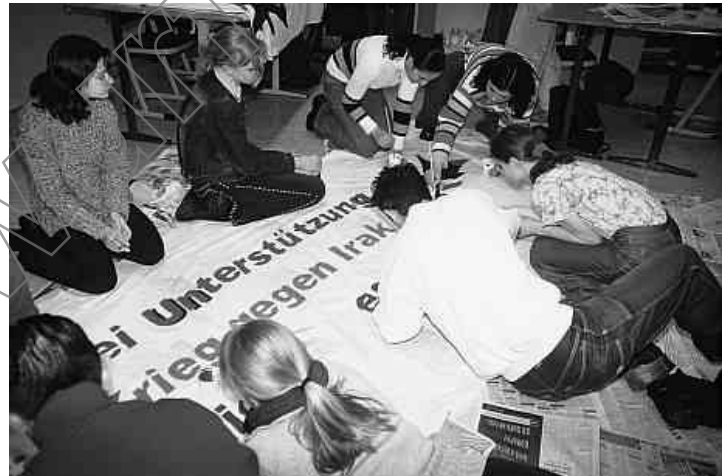
Schüler der DPF malen Transparent

„Berlin, Berlin, wir fahren nach Berlin!“ Der DPF und viele Freunde unterstützen die Protestdemonstration am 16.09. in Berlin gegen die Regierungspolitik, durch aktive Teilnahme oder auch durch das Malen von Transparenten.