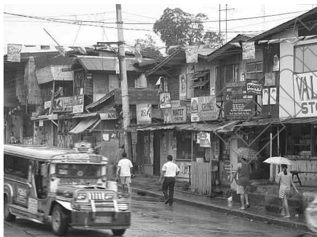
Bild: Das Manila der armen Stadtbevölkerung