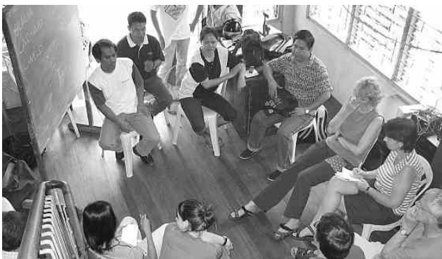
DPF trifft phil. Automobilarbeiter in Sta. Rosa, der Beginn einer neuen Freundschaft (2004)

Trotz der enorm schwierigen Lage derzeit auf den Philippinen mit 680 ermordeten Oppositionellen in 5 Jahren erkennt man an ihren Berichten, dass sie eisern an der gewerkschaftlichen Organisationsaufbauarbeit und ihren Forderungen festhalten. Das ist schon sehr beeindruckend!