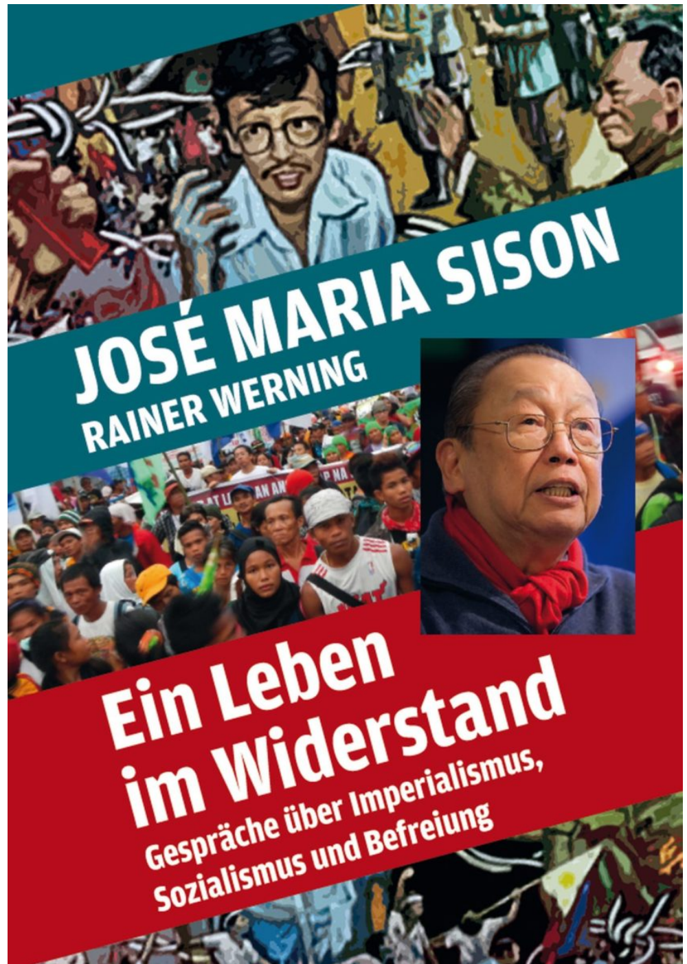
Buchcover von „Ein Leben im Widerstand“ © Verlag Neuer Weg

Vor einem Jahr gab Verteidigungschef Delfin Lorenzana zu, dass die kommunistische Rebellion nicht besiegt werden kann. Dennoch kündigte er das erneut aufgelegte Enhanced Comprehensive Local Integration Program (E-CLIP) an, in dessen Rahmen auf lokaler Ebene Friedensgespräche mit der NPA aufgenommen werden sollen - mit dem Ziel, das ländliche Rückgrat der bewaffneten Linken in den letzten drei Jahren der Amtszeit von Duterte [bis Mitte 2022] zu zerschlagen.