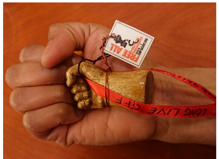
Die kleinen Holzfäuste haben die politischen Gefangenen hergestellt. Die Deutsch-Philippinischen Freunde verkaufen sie, der Erlös geht an die politischen Gefangenen.

Wir freuen uns immer über Spenden für die politischen Gefangenen.